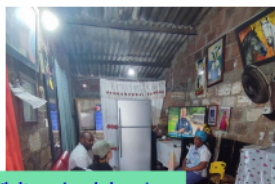
1. Visita a la vivienda

Propuesta para la instalación de un sistema de gestión y planificación de recursos de vivienda resiliente