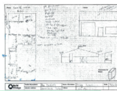
2. Diseño participativo